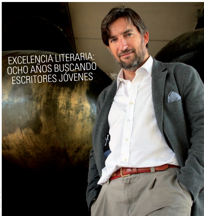
Entiende la literatura como vehículo para transmitir la antropología cristiana.